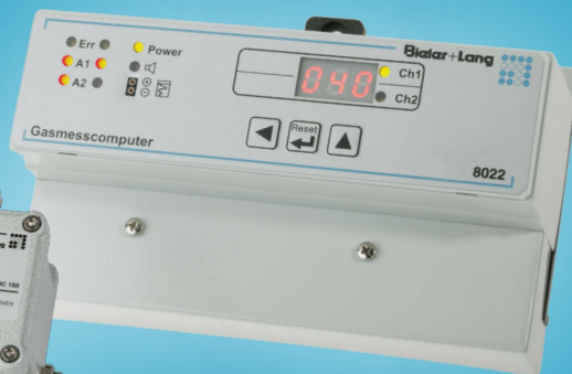
Gasmesscomputer GMC8022* mit dem Sensor ExDetector HC150**